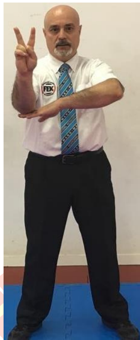
2ª ADVERTENCIA OFICIAL