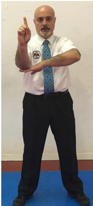
1ª ADVERTENCIA OFICIAL