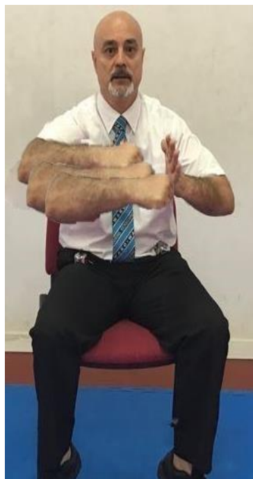
EXCESO DE CONTACTO