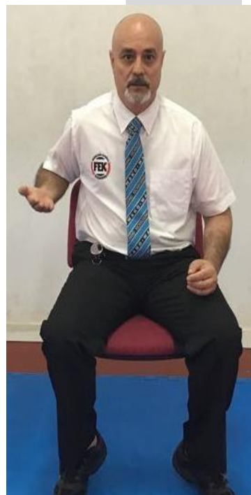
TÉCNICA POR ENCIMA DE LA CADERA