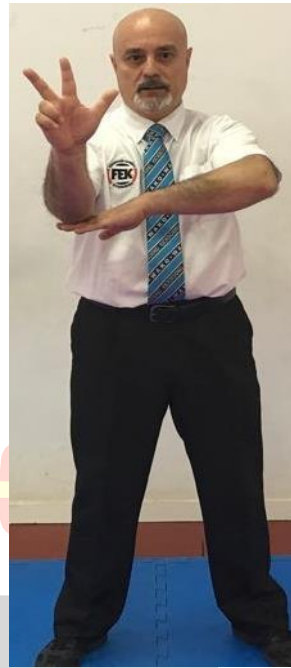
3ª ADVERTENCIA OFICIAL