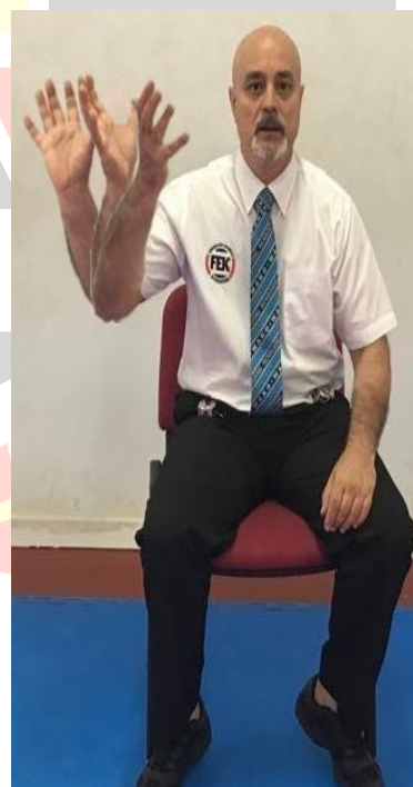
SE GIRA, NO MIRA TÉCNICA