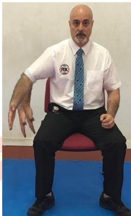
SALIDA - EXIT